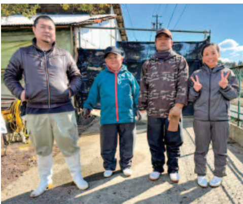
飼育員のみなさま

店の運営を決めたのも、私自身が松阪豚に感動した気持ちで伝えたくてからです。この美味しい豚を一人でも多くの人に食べてほしい。そして私の地元でもある松阪という地を盛り上げていきたい。色んな想いを呼び寄せてくれる『松阪豚』を私は本当に大事にしたいです」と話してくれました。